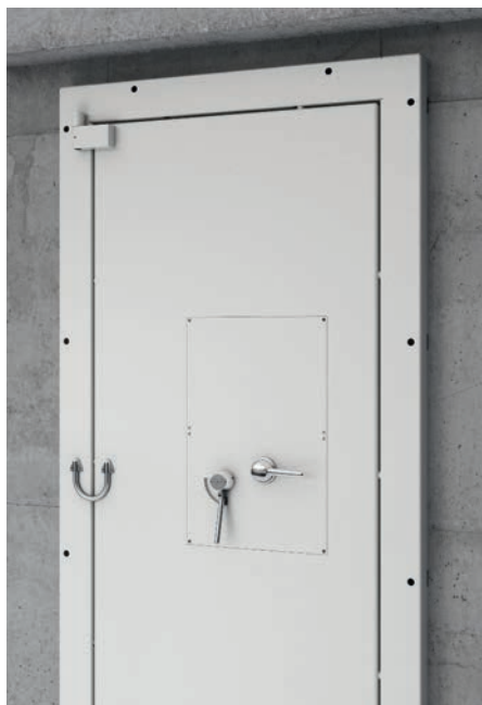
SRT Standard innen angeschlagen mit Notöffnung