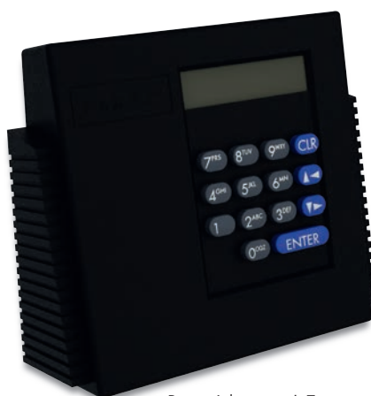
Paxos Advance mit Tastatur