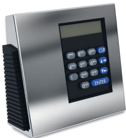
Paxos Advance mit Tastatur und verchromter Tastaturabdeckung