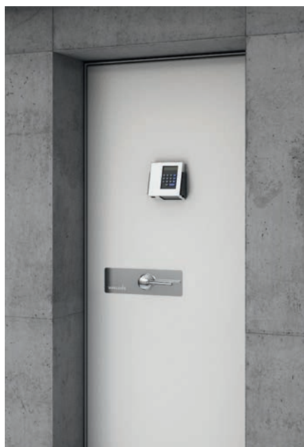
Ansicht Schutzraumtüre aussen