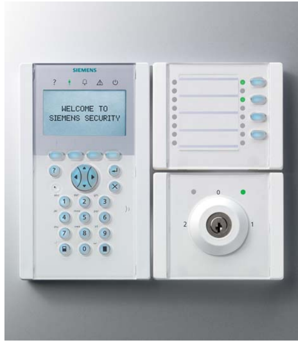
Umfangreiches Sortiment an Peripheriegeräten